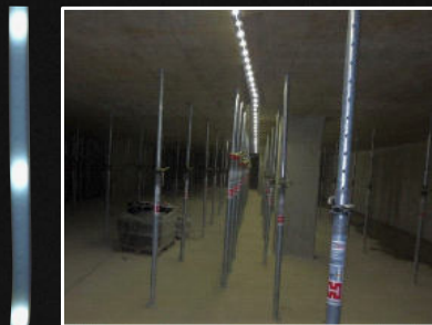
Sicherheitsbeleuchtung aus Akku-Betrieb