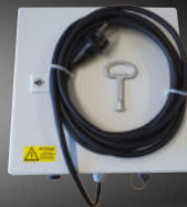
Lichtsteuerung im schlagfesten abschließbaren Metallgehäuse

Montieren - Demontieren - fachgerechte Lagerung - nächstes Bauvorhaben