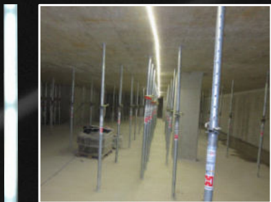
Bau- und Verkehrswegebeleuchtung aus Netzspannung