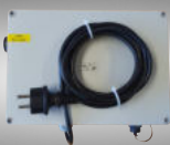
Lichtsteuerung im robusten Kunststoffgehäuse