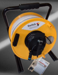
LED-Lichtband auf Trommel inkl. Montagematerial